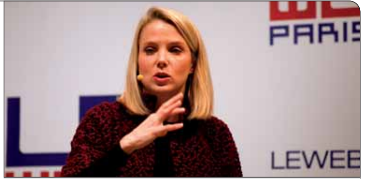
خانم مایر جزو ۲۰ کارمند اول گوگل و یکی از بزرگترین سرمایه های این شرکت بزرگ اینترنتی به حساب می آمده است که اکنون مدیریت یاهو را به عهده دارد

ما وارد بخش سخت افزار نخواهیم شد و بیشتر به این فکر هستیم که این امکان وجود داشته باشد که تمام سرویس های یاهو به راحتی روی تلفن های هوشمند و معمولی در دسترس بوده و هر کاربری بتواند به آسانی آن ها را تجربه کند.